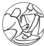
Le lavement des pieds