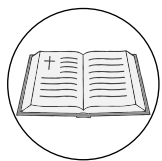
La bible ouverte