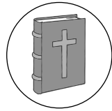
La bible fermée